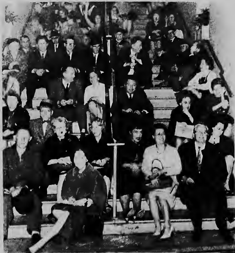
NEW YORK -- Pasaheronan cu a keda pega pa motibo cu treinnan subterraneeon no tabata corre, ta sinta riba trappinan di Gran Central Stacion na New York